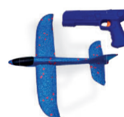
AVIÃO DE ESPUMA COM LANÇADOR DTY1273 De-22,99 POR 16,99 UN. DESC. 26%