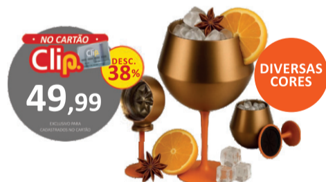
TAÇA TÉRMICA INOX 410ML PARA DRINKS COM PÉ REMOVÍVEL KRN1-16 De-79,99 POR 59,99 UN. DESC. 25%