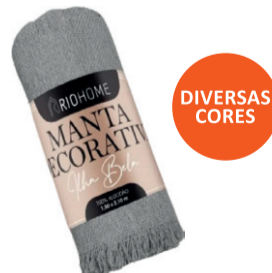
MANTA PARA SOFÁ ILHA BELA 150X210CM MAN002 De-62,99 POR 42,99 UN. DESC. 32%