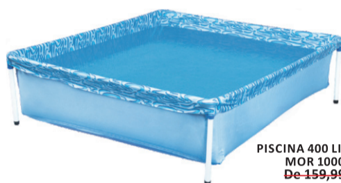
PISCINA 400 LITROS MOR 1000 De-159,99 POR 129,99 UN. DESC. 19%