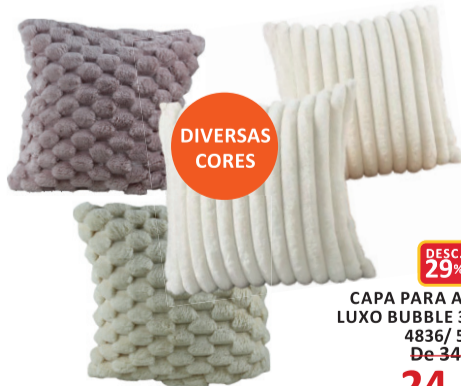
CAPA PARA ALMOFADA LUXO BUBBLE 3D 43X43CM 4836/ 5851 De-34,99 POR 24,99 UN. DESC. 29%