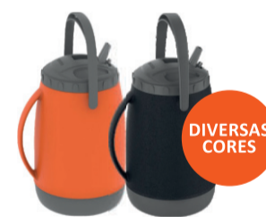
GARRAFA TÉRMICA ATACAMA 2,5 LITROS SOPRANO De-49,99 POR 39,99 UN. DESC. 20%