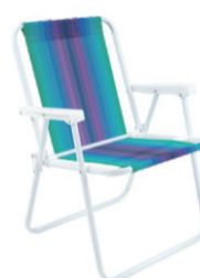
CADEIRA ALTA DE AÇO COLORIDA MOR 2002 De-89,99 POR 69,99 UN. DESC. 22%