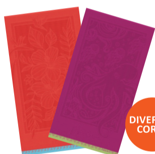
TOALHA DE PRAIA BANHÃO 80X150CM 440G/M2 COM IMAGENS EM ALTO RELEVO De-79,99 POR 59,99 UN. DESC. 25%