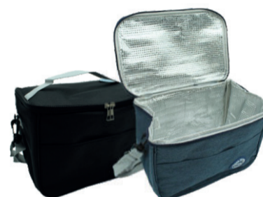
BOLSA TÉRMICA 12 LITROS FJ90632 FWB De-59,99 POR 39,99 UN. DESC. 33%