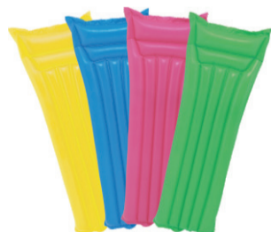
COLCHÃO INFLÁVEL SUMMER 183X69CM 1831 MOR De-39,99 POR 29,99 UN. DESC. 25%