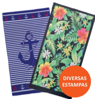
TOALHA DE PRAIA AVELUDADA 70X130/140CM De-24,99 POR 19,99 UN. DESC. 20%