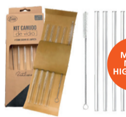
KIT COM 4 CANUDOS DE VIDRO REUTILIZÁVEIS + ESCOVA DE LIMPEZA DT24322 De-19,99 POR 12,99 UN. DESC. 35%