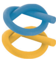
FLUTUADOR ESPAGUETE 165X6,5CM EM 6 CORES SORTIDAS De-9,99 POR 7,99 UN. DESC. 20%