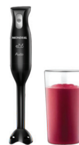
MIXER ELÉTRICO 2 EM 1 200W 72047-02 MONDIAL De-129,99 POR 109,99 UN. DESC. 15%