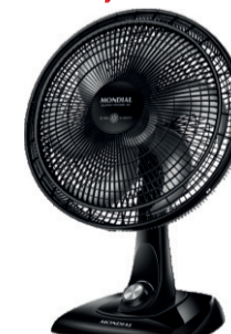
VENTILADOR DE MESA SUPER POWER 40CM 6 PÁS 4022-02 MONDIAL De-239,99 POR 199,99 UN. DESC. 17%