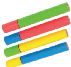
LANÇADOR DE ÁGUA DE ESPUMA 35CM DTY1034/1035 De-14,99 POR 9,99 UN. DESC. 33%