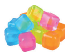
CONJUNTO COM 10 CUBOS DE GELOS COLORIDOS REUTILIZÁVEIS 6095 De-7,99 POR 5,99 UN. DESC. 25%