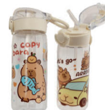
GARRAFA PARA ÁGUA CAPIVARA 400ML F5341 De-26,99 POR 19,99 UN. DESC. 26%