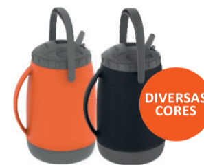
GARRAFA TÉRMICA ATACAMA 2,5 LITROS SOPRANO De-49,99 POR 39,99 UN. DESC. 20%