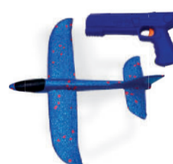
AVIÃO DE ESPUMA COM LANÇADOR DTY1273 De-22,99 POR 16,99 UN. DESC. 26%