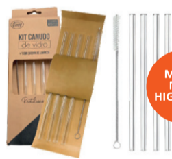
KIT COM 4 CANUDOS DE VIDRO REUTILIZÁVEIS + ESCOVA DE LIMPEZA DT24322 De-19,99 POR 12,99 UN. DESC. 35%