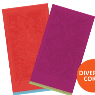
TOALHA DE PRAIA BANHÃO 80X150CM 440G/M2 COM IMAGENS EM ALTO RELEVO De-79,99 POR 59,99 UN. DESC. 25%