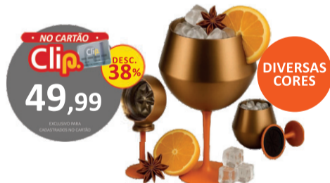
TAÇA TÉRMICA INOX 410ML PARA DRINKS COM PÉ REMOVÍVEL KRN1-16 De-79,99 POR 59,99 UN. DESC. 25%