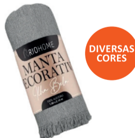
MANTA PARA SOFÁ ILHA BELA 150X210CM MAN002 De-62,99 POR 42,99 UN. DESC. 32%