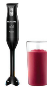
MIXER ELÉTRICO 2 EM 1 200W 72047-02 MONDIAL De-129,99 POR 109,99 UN. DESC. 15%