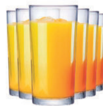
CONJUNTO COM 6 COPOS DE VIDRO 255ML PLIC HOME