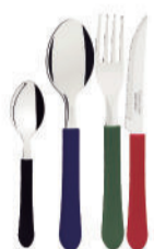
TALHER INOX TRAMONTINA LEME TRAMONTINA - 23182410

Uma NOVIDADE : Preços ÚNICOS , escolhas FÁCEIS !