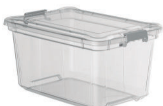
CAIXA ORGANIZADORA 27 LITROS - 14814600