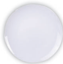
PRATO RASO TRAMONTINA EM PORCELANA 28CM 96010/101