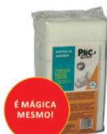
ESPONJA MÁGICA COM 6 UNIDADES RCUD033