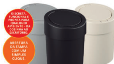
LIXEIRA COM TAMPA PRESS 5,4L CINZA CLARO/CINZA ESCURO/PRETO 10908/0008-10908/0468-10908/0499