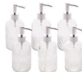
PORTA SABONETE LÍQUIDO DE VIDRO 380ML 7422