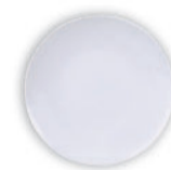
PRATO SOBREMESA TRAMONTINA EM PORCELANA 19CM 96010/206