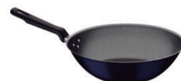
PANELA WOK 24CM RAVENA AZUL 27815889