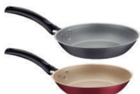
FRIGIDEIRA 20CM TURIM CHUMBO/VERMELHA TRAMONTINA - 20260620