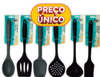
UTENSÍLIOS DIVERSOS EM SILICONE PLIC HOME RCUD016 A 23