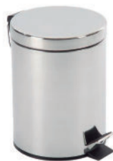
LIXEIRA 5 LITROS EM AÇO INOX RCUD035