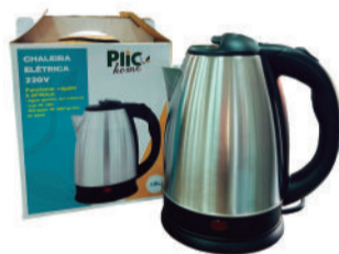
CHALEIRA ELÉTRICA RCUD005