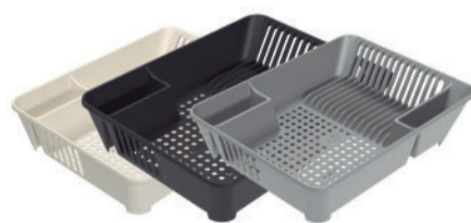
ESCORREDOR DE LOUÇAS BASIC 10848/0008