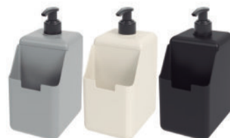
DISPENSER SINGLE PARA DETERGENTE - 500ML 17008/0008 - 17008/0468 - 17008/0499