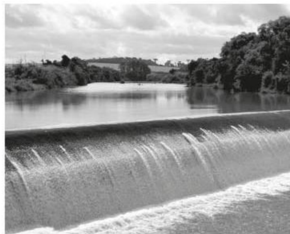
Estado tem vocação no desenvolvimento de Pequenas Centrais Hidrelétricas

A Coprel, inicialmente, também fazia parte do projeto da Linha Onze Oeste, mas atualmente essa PCH está sendo conduzida apenas pela cooperativa Ceriluz, de Ijuí. Nesse último leilão, a cooperativa foi contemplada com a venda de 5,9 MW, ao valor de R$ 268,45 o MWh, o que corresponde a R$ 277 milhões em comercialização em um período de 20 anos. A usina, que já está em implantação e havia vendido parcela da sua geração em certame realizado em 2021, e por isso não foi apontada como investimento novo pela CCEE, envolverá um aporte de cerca de