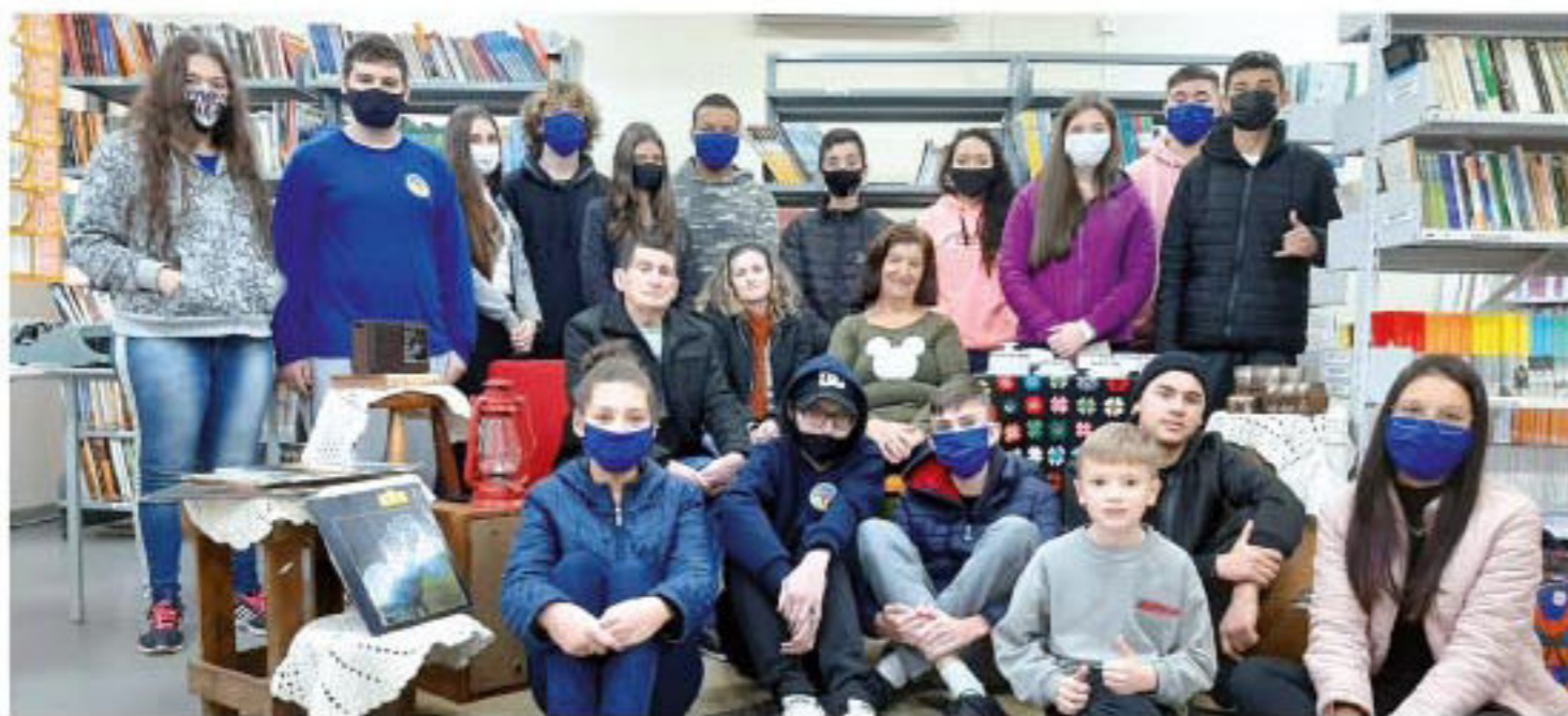
Os alunos, através de rodas de conversas, estão conhecendo histórias inspiradoras de membros da comunidade