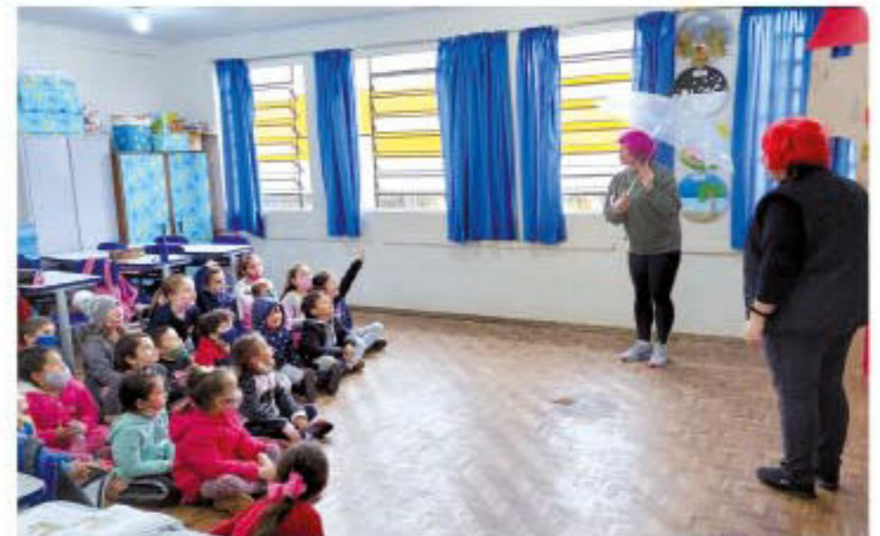
Apresentação da história prendeu a atenção das crianças do Ijuizinho