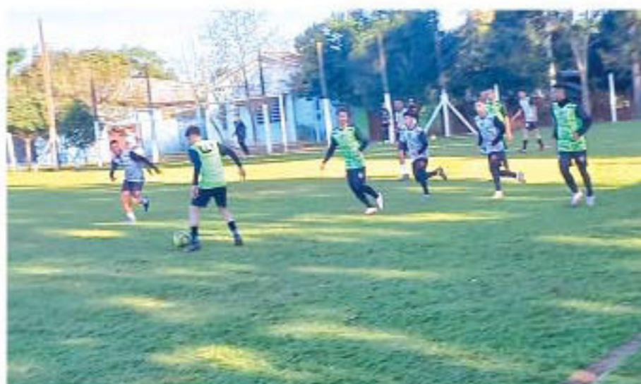
Profissional realizou um coletivo contra o sub-17 no campo do Lambari