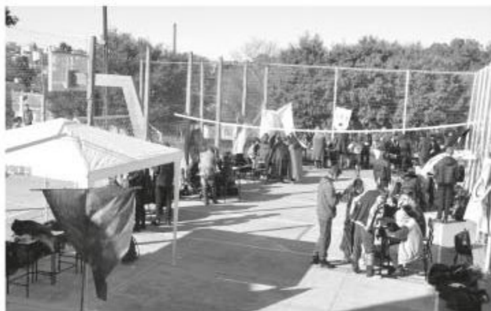
Alunos se reuniram em equipes para realizar as atividades da gincana