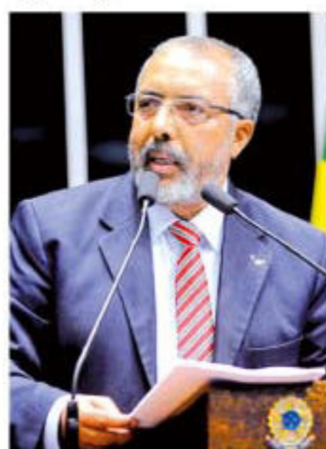
Senador Paulo Paim

Paim observa que, atualmente, a legislação brasileira trata a injúria racial e o racismo de maneira distinta. O parlamentar explica que uma das consequências dessa mudança é que a ofensa racial passará a ser tratada como crime