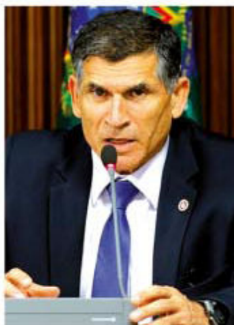
General Santos Cruz

O general, que foi ministro da Secretaria de Governo de Bolsonaro é hoje um grandes críticos do presidente por envolver as Forças Armadas na crise.