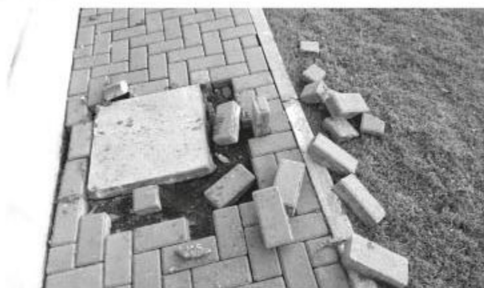
Além do arrombamento, criminosos também vandalizaram calçada da Unidade

"Acordei com a notícia de que tinham arrombado o posto. Isso é uma grande tristeza, pois quem vai ser prejudicado serão, além dos moradores do bairro Herval, Industrial, São José, enfim, cerca de 5 mil pessoas vão deixar de ser atendidas pelo dentista porque não tem aparelho. O que