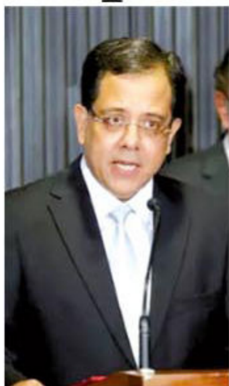
Ministro Sérgio Banhos

Na consulta, o PSD também perguntou se seria permitido o pagamento, mediante Pix, pelas