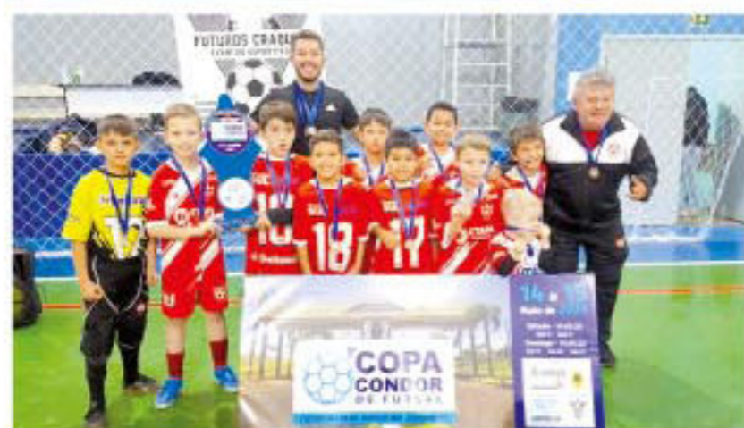
GBM conquistou o título no futsal na categoria Sub-9 em Condor