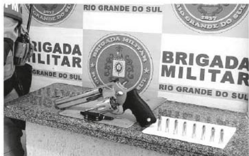
Pistola Magnum .357 tem alto poder de fogo e foi apreendida na última semana

Neste ano, outra apreensão na região impediu que espingardas semiautomáticas chegassem às mãos de organizações criminosas na região. A apreensão ocorreu em Panambi e foi feita pela Polícia Rodoviária Federal (PRF), em janeiro.