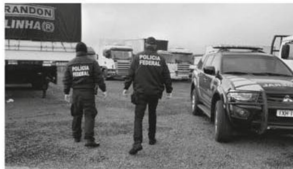
Caminhões, automóveis e outros itens foram apreendidos durante a ação

Ao longo das investigações, foram apreendidos 12 milhões de maços de cigarros estrangeiros e 41 caminhões, além de presas em flagrante 44 pessoas. O valor estimado dos cigarros recolhidos é de R$ 60 milhões, com aproximadamente R$ 30 milhões em tributos sonegados.