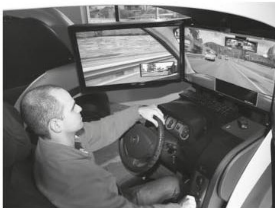
Em 2014, o Contran instituiu a obrigatoriedade do uso de simulador em todo o País

Porém, em novembro de 2019, os desembargadores da mesma turma entenderam que o equipamento deveria continuar sendo usado em solo gaúcho, a partir de um questionamento do Sindicato dos Centros de Formação de Condutores do Estado do Rio Grande do Sul (SindiCFC-RS).